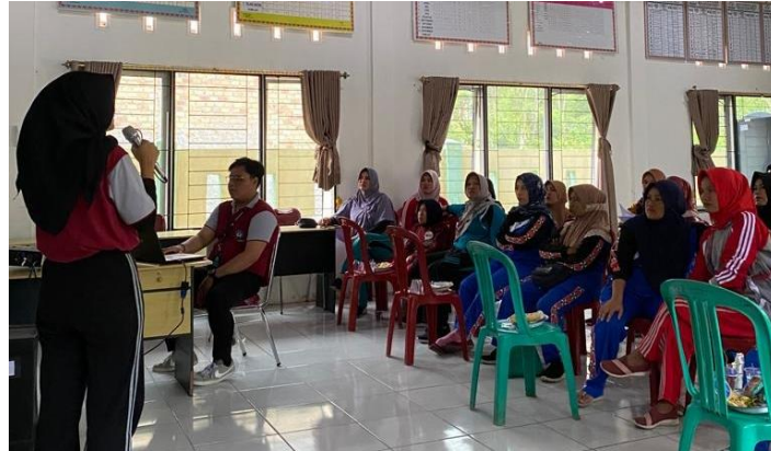
Gambar 1. Kegiatan Sosialisasi Eco-enzyme

Selain sebagai pupuk, cairan eco-enzyme juga dapat digunakan untuk meningkatkan kesuburan pada tanah gersang sehingga dapat dijadikan sebagai media tanam kembali. Selain itu, cairan eco-enzyme dapat menjadi pengganti pestisida. Pembuatan larutan eco-enzyme sebagai pestisida dilakukan dengan mencampurkan cairan eco-enzyme dan air dengan perbandingan yang sama dengan campuran cairan pupuk. Cairan tersebut dapat langsung diaplikasikan di tempat yang terkena hama.