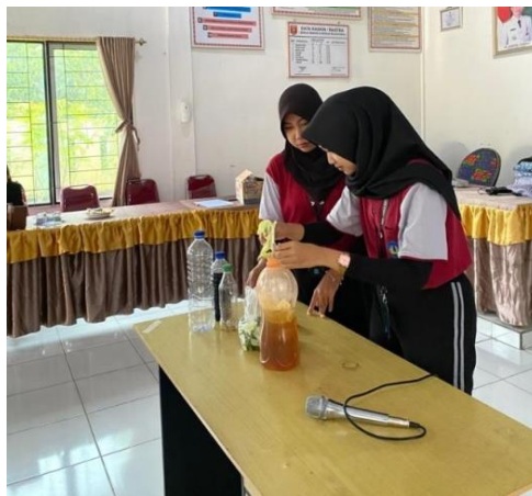
Gambar 2. Pembuatan Campuran Fermentasi Eco-enzyme

Menurut Chahaya et al. (2022), terdapat beberapa hal yang perlu diperhatikan untuk mendapatkan hasil fermentasi yang baik, yaitu: