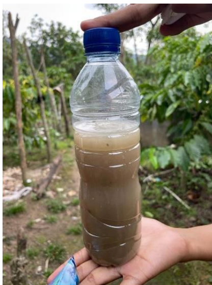
Gambar 3. Hasil Pupuk Organik

Pupuk organik berbahan dasar nasi basi ini memiliki segudang manfaat untuk pertumbuhan tanaman karena mengandung nitrogen total sebesar 92 mg/L serta membawa unsur yang dibutuhkan oleh tumbuhan baik unsur mikro maupun unsur makro (Ria, Noer, & Marhento, 2021). Selain itu, pupuk organik limbah nasi basi ini mengandung Karbon (C) sebesar 2,65%, Fosfor (P) total sebesar 0,29%, Kalium (K) total sebesar 0,23%, dengan perbandingan antara karbon dan nitrogen sebesar 16,56%. Nitrogen berperan sebagai penyusun protein yang digunakan untuk pertumbuhan pucuk tanaman dan menunjang pertumbuhan vegetative (Kartana & Kurniati, 2020). Unsur karbon secara umum memiliki manfaat sebagai pembentuk fisik tanaman. Fosfor berperan sebagai penyalur energi untuk menunjang proses pertumbuhan dan perkembangan tanaman, serta merangsang pematangan buah dan pembungaan pada tanaman. Sedangkan Kalium berperan dalam proses fotosintesis dan respirasi.