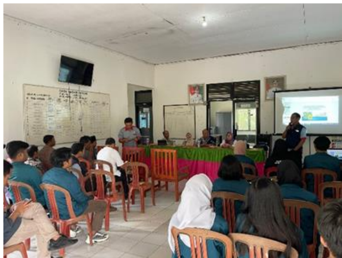
Gambar 1. Penyuluhan Oleh Klinik Pertanian Unila

Dalam kegiatan ini dijelaskan bahwa kutu putih adalah hama yang menyerang tanaman baik tanaman hias maupun tanaman buah. Kutu putih dewasa mempunyai tubuh yang berbentuk oval, serta ditutupi dengan tepung putih berlilin, kutu putih termasuk kedalam hama yang bersifat partenogenetik telitoki, atau jenis hama yang keturunannya hanya betina. Pada kondisi yang optimum seekor hama kutu putih dapat menghasilkan 200-400 butir telur. Telur kutu putih mempunyai bentuk oval dengan warna kuning dan dilapisi oleh kantong telur. Kutu putih mempunyai siklus hidup sekitar 48-57 hari dari telur hingga dewasa. Kutu putih menyerang tanaman dengan cara menghisap cairan yang ada pada bagian daun dan batang muda tanaman, akibatnya daun atau batang akan mengkerut dan mengerdil atau tidak dapat tumbuh dengan semestinya, bahkan serangan hama ini dapat membuat daun tanaman rontok.