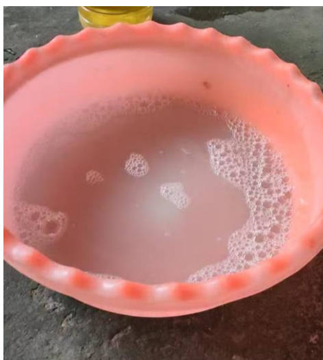
Gambar 2. Hasil Pestisida Alami

Demonstrasi pembuatan dan penggunaan campuran detergen ini dilaksanakan di Pekon Lombok Selatan, Kecamatan Lombok Seminung, Lampung Barat. Kegiatan ini memaparkan cara pembuatan dan penggunaan campuran larutan detergen. Pengendalian dengan menggunakan campuran tersebut telah diterapkan sebelumnya oleh salah satu pemateri dari Klinik Pertanian Universitas Lampung. Penggunaan campuran ini telah diaplikasikan dan berhasil untuk membasmi hama kutu putih di kebun alpukat milik pemateri dengan luas kebun 20.000 m 2 .