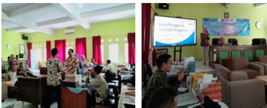
Gambar 2. Ice Breaking dan Pemaparan Materi

Pemateri sebelum memulai edukasi, memberikan ice breaking kepada guru ekonomi (peserta) PbM agar peserta ada dalam fase alpha zone dan siap untuk mendapatkan materi dengan rileks dan santai. Pada sesi ini peserta mendapatkan materi terkait dengan Guru Penggerak dan Sekolah Penggerak yang terdiri dari: a) profil pelajar pancasila dalam kurikulum merdeka; b) latar belakang program guru penggerak; c) proses menjadi guru penggerak; d) materi dan capaian pembelajaran dalam guru penggerak; e) mekanisme seleksi guru penggerak; f) pengenalan program sekolah penggerak; g) target jangka panjang program sekolah penggerak; h) manfaat program sekolah penggerak; i) mekanisme dan persyaratan program sekolah penggerak.